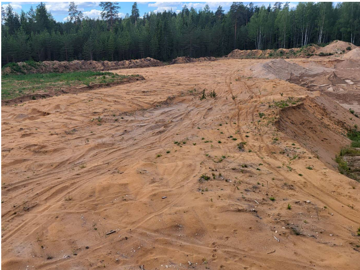
Foto 2. Liiva kaevandamiseks ettevalmistatud ala – katend on järk-järgult kooritud ja ladustatud puistangutesse. Pildistas Ranek Rohtla.

Kattekihi (mulla) maht mäeeraldise alal kokku on 35 tuh m 3 . Katend on suurelt osalt mäeeraldise alalt juba kooritud ja kooritakse lähtuvalt prognoositavast kaevandamise mahust järk-järgult ja ladustatakse ajutiselt mäeeraldise teenindusmaale. Katendi koorimine etappide kaupa välistab katendi pikaajalise säilitamise puistangutes. Muld on vallitatud ja vallitatakse kuni 3 m kõrgustesse aunadesse. Säilitamiseks mulla bioloogilist aktiivsust, ei tohi aunasid tihendada. Katendi koorimine ja vallitamine toimub kuival aastaajal pinnase loodusliku niiskuse juures. Vastav mäetööde korraldamine võimaldab kaevandamisega samaaegselt alustada ammendatud alade korrastamistööd. Pugastu I liivakarjäär korrastatakse metsamaaks. Mäetööde arenedes kasutatakse kooritud katendit vähemalt kolme aasta jooksul selle ladustamisest kaevandatud ala bioloogiliseks korrastamiseks. Katend on plaanis kogu mahus (35 tuh m 3 ) ära kasutada karjääri korrastamisel. Ala korrastamisel metsamaaks laotatakse karjääri nõlvadele ja põhjale alalt varem kooritud kattepinna. Seega on välistatud kattepinna muutumine jäätmeteks jäätmeseaduse mõistes. Katendi ladustamine mäeeraldise teenindusmaale ei nõua suletud jäätmeoidla järelhooldust ega järelevalvet, õhu või vee kaudu eralduvate saasteainete teke ja levik on välistatud.