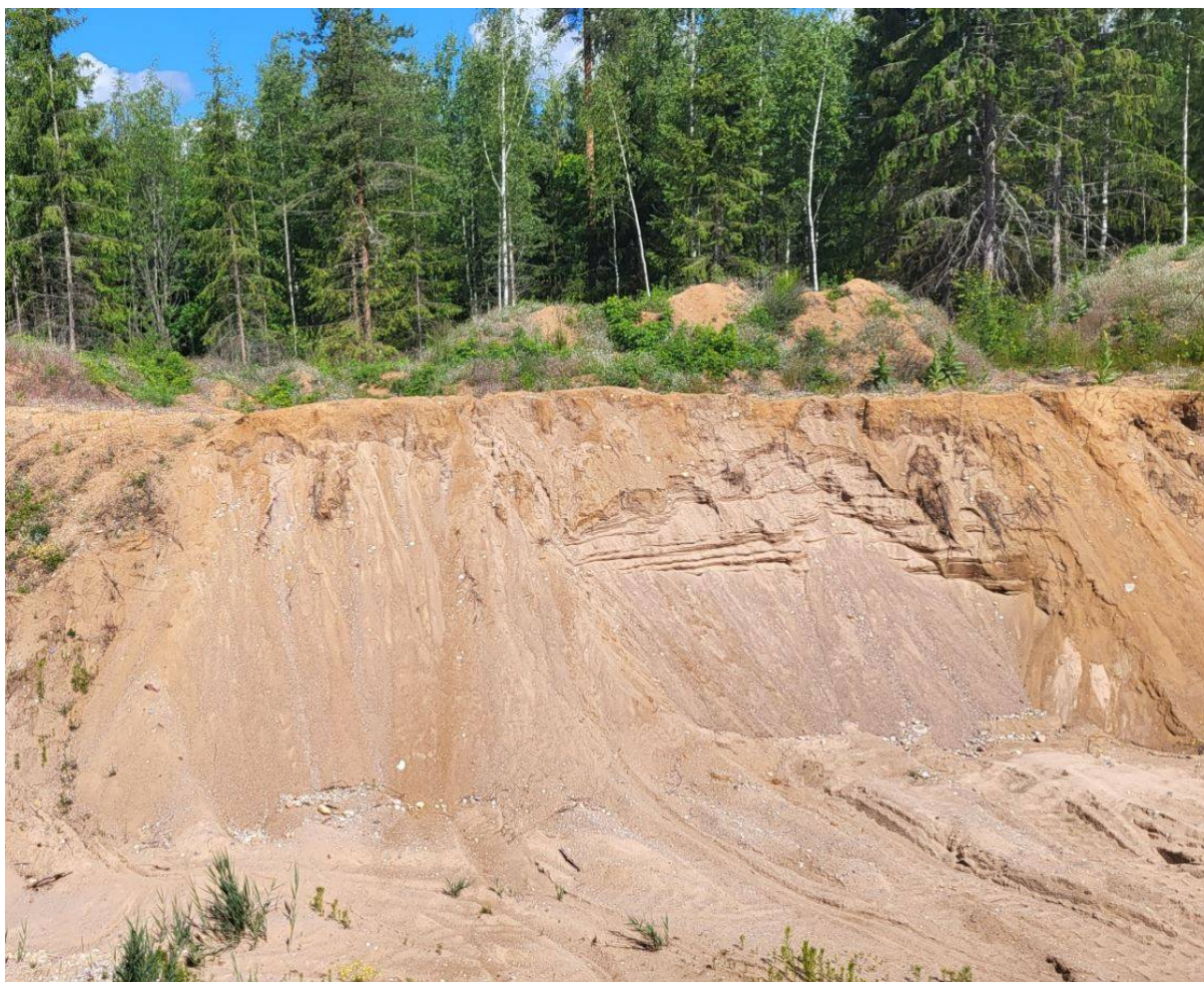
Foto 1. Liiva nõlv Pugastu I liivakarjääris. Jämeperdse materjali sisaldus on liivas keskmiselt vaid 5,2%. Liiva kasutatakse looduslikul kujul ja sõelutult betooni valmistamiseks.

Ala geoloogiline ehitus on suhteliselt lihtne. Uuringu andmetel levib siin jääjõelise tekkega peene- kuni jämedateralise liiva (foto 1) põimjaskihiline kompleks, milles kruusa (osakeste läbimõõduga üle 5 mm) sisaldus on keskmiselt 5,2%. Liiv on kvartspäevakivi koostisega, kruusafraktsioonis (osakesed läbimõõduga üle 5 mm) on valdavaks karbonaatne materjal. Kasuliku kihi paksus puuraukude andmetel on 4,7...13,1 m, keskmisena 8,0 m (tabel 1). Kasuliku kihi lamami moodustab hall savikas moreen, katendiks on keskmiselt 0,4 m paksune kasvukiht (muld).